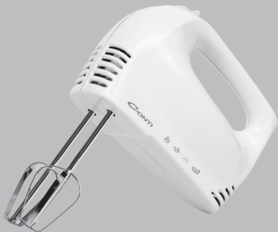
СМХ-105 ЕЛЕКТРИЧЕСКИ МИКСЕР